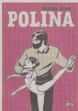
Bastien Vivès, Polina (Casterman). Le titre cartonne. Devinez qui est l'imprimeur aux manettes ?

Petite anecdote : dans les bacs de vos librairies spécialisées, vous trouverez l'ouvrage remarquable de